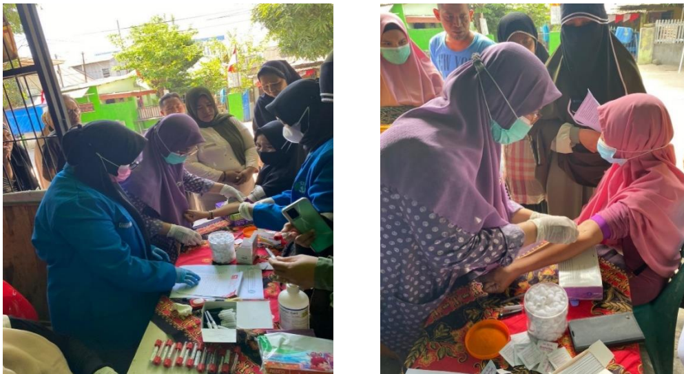
Gambar 3. Proses Pengambilan Darah Peserta

Kegiatan pelayanan kesehatan berupa pemeriksaan kreatinin. namun sebelum dilakukan pengambilan sampel darah. para tim pelaksana melakukan persiapan peralatan dan bahan yang digunakan dalam pengambilan sampel darah. kemudian pengambilan darah yang dilakukan oleh anggota tim pelaksana. atlm yang mengambail darah hanya satu orang, sedangkan anggota tim yang lain membantu dalam pelayanan. pada saat proses pengambilan sampel, terdapat warga yang tidak dilakukan pengambilan darah karena ketersediaan tabung dan jarum yang tidak cukup. seperti gambar berikut kegiatan pengambilan darah.