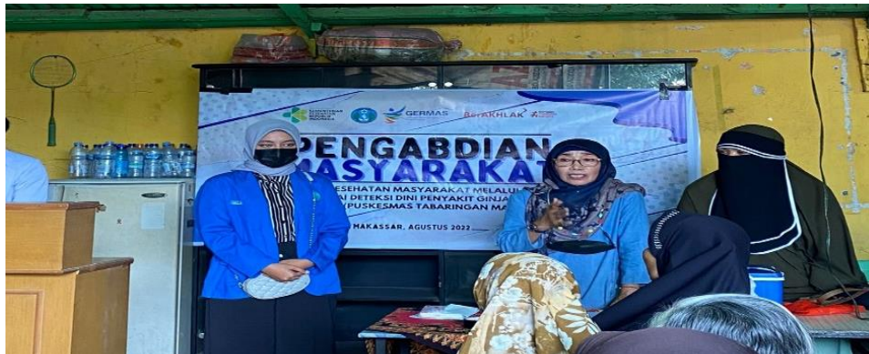
Gambar 1. Pembukaan Kegiatan Pengabdian Masyarakat

Pembukaan dibawakan oleh tim pelaksana yang dihadiri oleh staf puskesmas Tabaringan, kader posyandu. selain itu terdapat mahasiswa kedokteran yang praktek di pusekesmas tabaringan yang memberikan pula edukasi kesehatan. tim pelaksana melibatkan mahasiswa yang membantu dalam proses pengabdian ini. secara keseluruhan kegiatan dilakukan sekitar 120 menit. lamanya waktu pengambilan darah peserta dikarenakan para peserta banyak yang hadir. ketercapaian kegiatan ini terlihat peserta yang hadir merasa antusias adanya pemeriksaan kesehatan di kelurahan, menurut kader setempat bahwa kegiatan pemeriksaan kesehatan lebih suka dan tertarik warga karena pemeriksaan gratis. warga kelurahan tamalabba termasuk masyarakat yang cukup sadar akan kesehatan mereka. selain itu peserta mengikuti secara penuh mulai dari awal kegiatan sampai menunggu giliran untuk pengambilan darah. hal ini terbukti dalam kegiatan ini dihadiri peserta sebanyak 49 orang diantaranya 40 (81,6%) perempuan dan 9 (18,4%) laki-laki (Gambar 2).