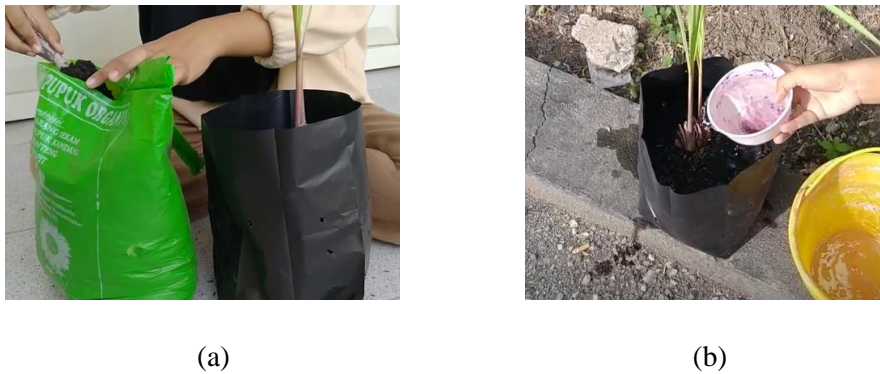
Gambar 1. Kegiatan a) penanaman TOGA, b) perawatan TOGA

Alat yang dibutuhkan dalam pembuatan minuman herbal adalah pisau potong, mangkuk, talenan, panci, kompor, dan gelas ukur. Bahan yang diperlukan dalam pembuatan minuman herbal seperti yang ditunjukkan pada Gambar 2 adalah 1 ruas serai, jahe, kunyit, temulawak, 500 ml air dan gula jawa.