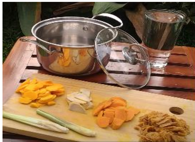
Gambar 2. Persiapan bahan pembuatan minuman herbal

Alat yang dibutuhkan dalam pembuatan minuman herbal adalah pisau potong, mangkuk, talenan, panci, kompor, dan gelas ukur. Bahan yang diperlukan dalam pembuatan minuman herbal seperti yang ditunjukkan pada Gambar 2 adalah 1 ruas serai, jahe, kunyit, temulawak, 500 ml air dan gula jawa.