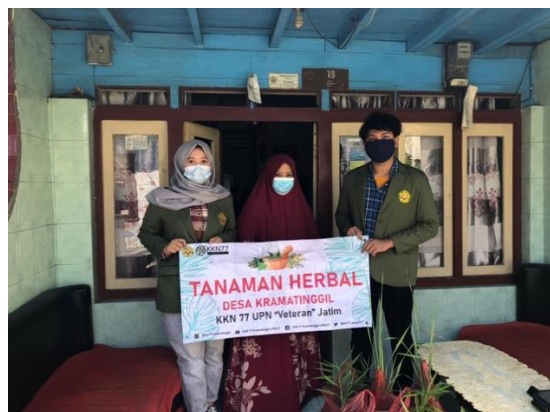
Gambar 6. Pembagian minuman herbal kepada warga setempat

Pembuatan minuman herbal yang dibuat oleh Divisi Ketahanan Pangan sebanyak 30 botol. Minuman tersebut dibagikan kepada 13 RT yang terdapat di Kelurahan Kramatinggil, di mana setiap RT mendapatkan 5 botol minuman herbal yang dibagikan secara acak. Pembagian minuman herbal kepada warga Kelurahan Kramatinggil yang dilakukan secara luring dapat dilihat pada Gambar 6 dengan menerapkan protokol kesehatan dan jumlah orang yang terbatas sesuai anjuran pemerintah (Harun et al., 2021).