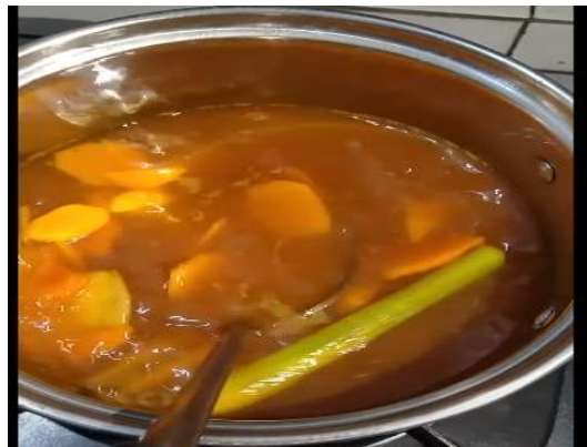
Gambar 3. Proses memasak minuman herbal